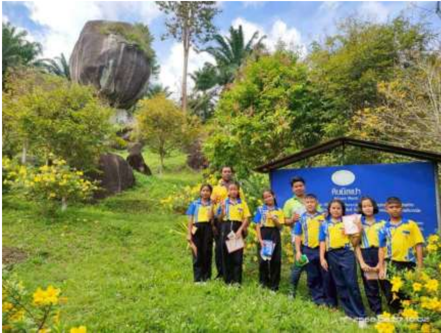
นักเรียนเข้าร่วมกิจกรรมศึกษาแหล่งเรียนรู้ประวัติศาสตร์ในชุมชน ณ พระธาตุหินนิลเปา อำเภอคีรีรัฐนิคม