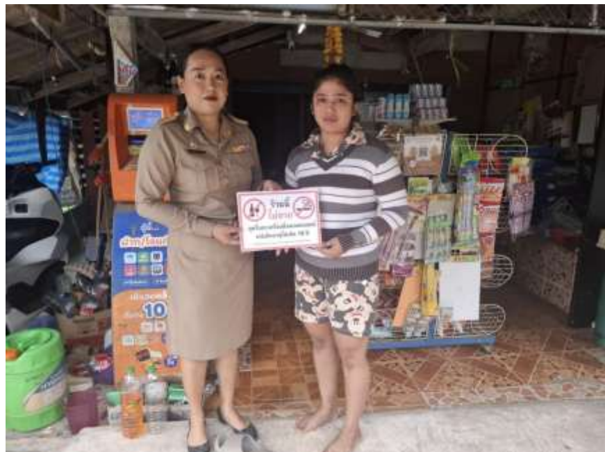
โรงเรียนจัดทำป้ายขอความร่วมมืองดจำหน่ายบุหรี่และเครื่องดื่มแอลกอฮอล์ แก่นักเรียนร่วมกับร้านค้าบริเวณโดยรอบโรงเรียน