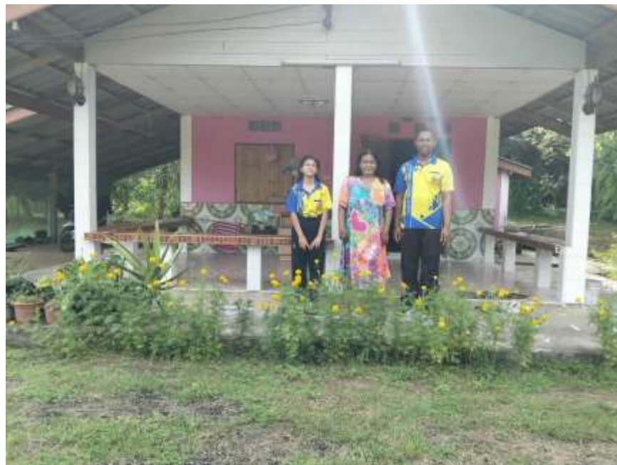
กิจกรรมลงเยี่ยมบ้านนักเรียนโดยครูประจำชั้น ประจำปี ๒๕๖๘

โรงเรียนจัดทำประกาศนโยบายต่าง ๆ ที่เกี่ยวข้องกับสถานศึกษาสีขาว ปลอดภัย เสพติด และอบายมุข และเผยแพร่ให้คณะครู นักเรียน หรือผู้อื่นได้ทราบ