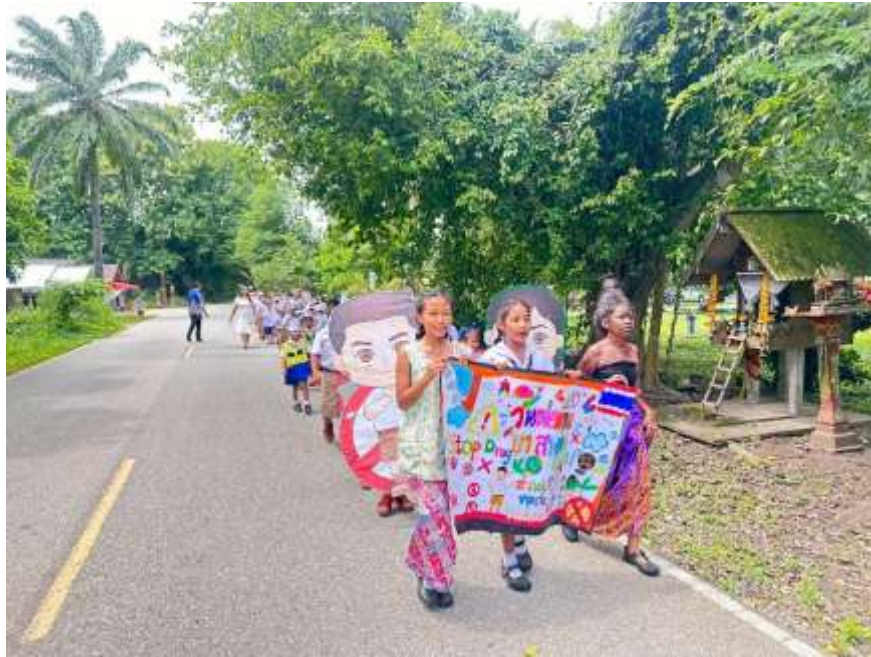
ผู้บริหาร คณะครู และนักเรียนร่วมกันเดินรณรงค์กิจกรรมวันต่อต้านยาเสพติด บริเวณชุมชนรอบโรงเรียน