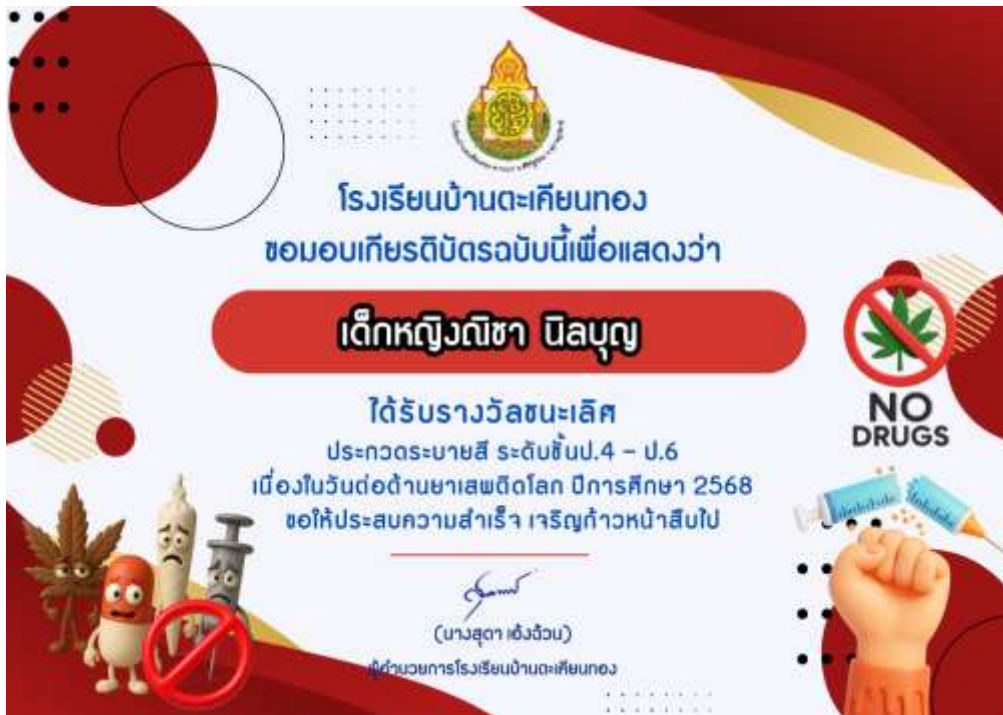
ภาพเกียรติบัตรนักเรียนเข้าร่วมกิจกรรมระบายสี เนื่องในวันต่อต้านยาเสพติดโลก ปีการศึกษา ๒๕๖๘