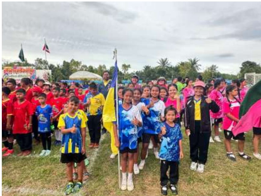
ผู้บริหาร คณะครู และนักเรียนเข้าร่วมกิจกรรมกีฬาเครือข่ายสถานศึกษาคีรีรัฐนิคม ๑ ประจำปี ๒๕๖๘