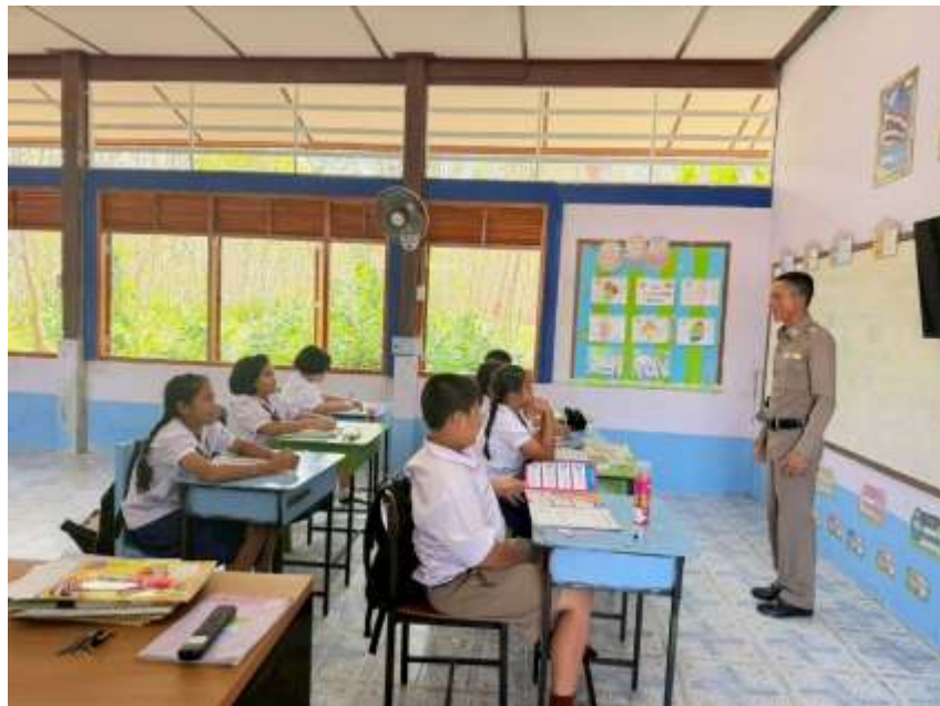
นักเรียนเข้าร่วมโครงการศึกษาเพื่อต่อต้านการใช้ยาเสพติดในเด็กนักเรียน (D.A.R.E.) โดยเจ้าหน้าที่ตำรวจจากสถานีตำรวจภูธรศรีรัฐนิคม