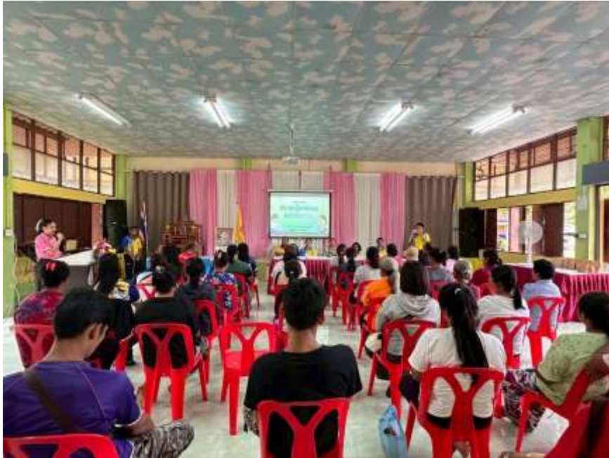
กิจกรรมประชุมผู้ปกครอง ประจำปี ๒๕๖๘ ณ อาคารอเนกประสงค์โรงเรียนบ้านตะเคียนทอง