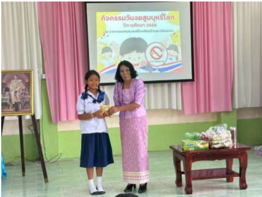
โรงเรียนจัดกิจกรรมให้ความรู้และมอบของรางวัลเนื่องในวันงดสูบบุหรี่โลก ประจำปีการศึกษา ๒๕๖๘