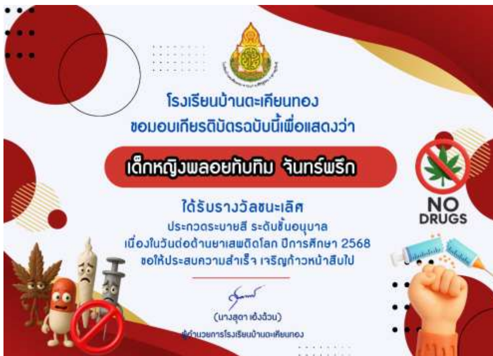
ภาพเกียรติบัตรนักเรียนเข้าร่วมกิจกรรมระบายสี เนื่องในวันต่อต้านยาเสพติดโลก ปีการศึกษา ๒๕๖๘