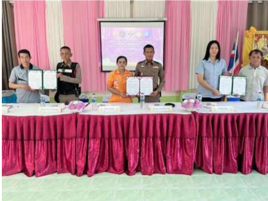
การจัดทำบันทึกข้อตกลงความร่วมมือ (MOU) โครงการสถานศึกษาสีขาว ปลอดภัย เสพติด และอบายมุข ร่วมกับภาคีเครือข่าย ณ อาคารอเนกประสงค์โรงเรียนบ้านตะเคียนทอง