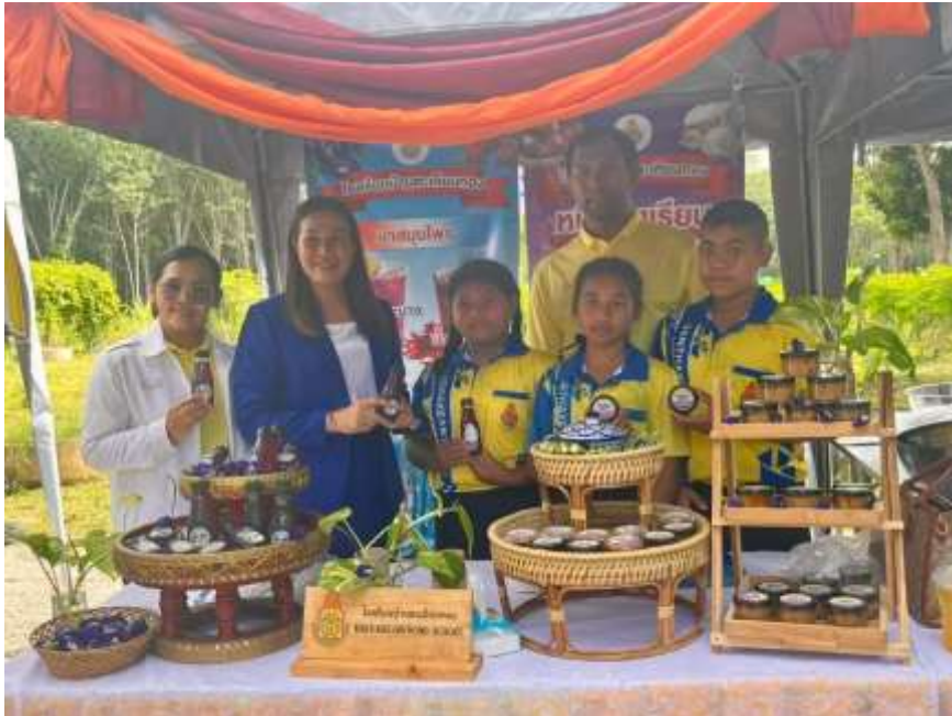
ผู้บริหาร คณะครู และนักเรียน นำเสนอผลงานด้าน Soft Power น้ำดื่มสมุนไพรและน้ำพริกมะขาม กิจกรรมวันเปิดโลกทักษะวิชาการ เครือข่ายสถานศึกษาขั้นพื้นฐานอำเภอบ้านตาขุน และตำบลกะเปา อำเภอคีรีรัฐนิคม ประจำปีการศึกษา ๒๕๖๘ ณ โรงเรียนวัดพุดศรี