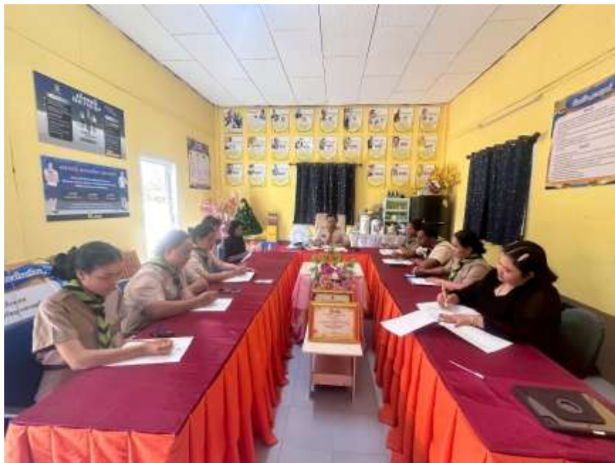
ผู้บริหาร คณะครูและบุคลากร ประชุมการดำเนินงานโครงการสถานศึกษาสีขาว ปลอดภัยเสพติด และอบายมุข ณ อาคารอเนกประสงค์โรงเรียนบ้านตะเคียนทอง