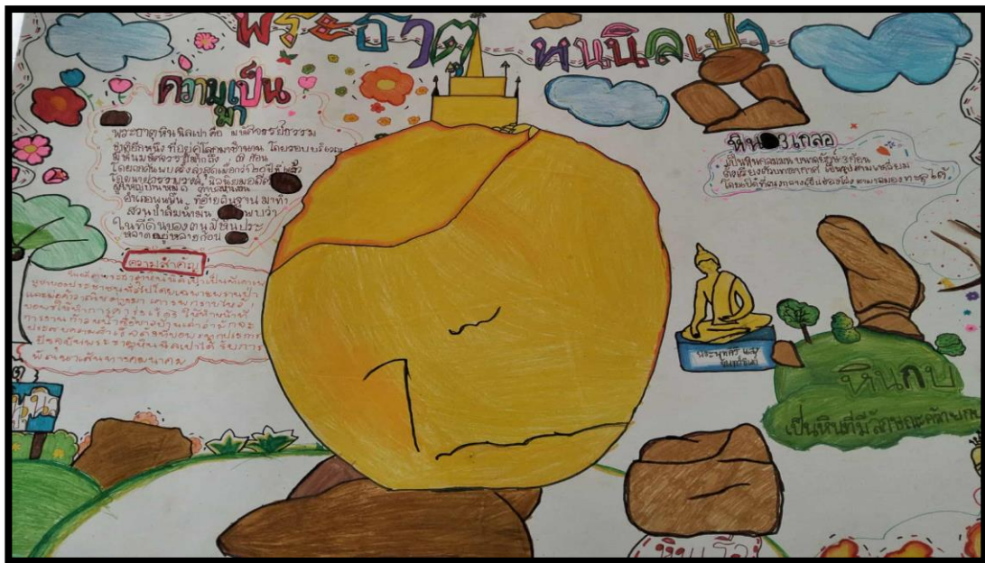
นายณภัทรพี ชูรัตน์ โรงเรียนบ้านตะเคียนทอง สำนักงานเขตพื้นที่การศึกษาประถมศึกษาสุราษฎร์ธานี เขต ๒